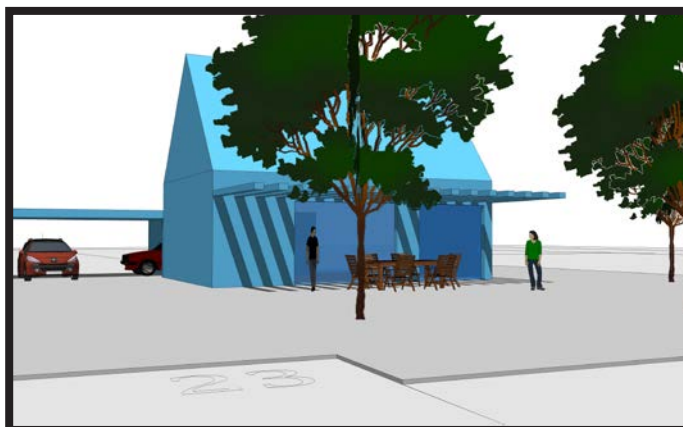
Ce projet d'implantation a bénéficié du conseil du CAUE

Ce projet de maison neuve à Stotzheim a bénéficié des conseils du CAUE du Bas-Rhin. Consulté en amont du projet, un architecte-conseiller a imaginé des solutions pour l'implantation des constructions, afin de libérer un grand jardin au sud et d'y ouvrir les pièces principales de la maison.