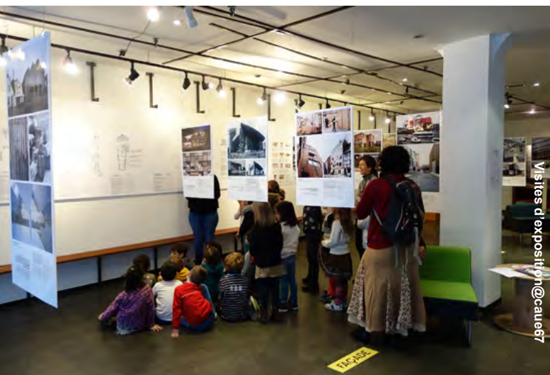
Visites d'exposition @caue67