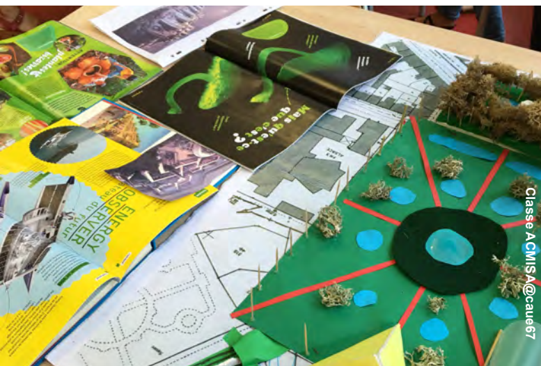
Classe ACMISA @caue67

L'Etat, à travers la loi du 3 janvier 1977 sur l'architecture, renforcée par la loi relative à la liberté de création, à l'architecture et au patrimoine (LCAP) en 2016, confie aux CAUE la mission d'initier le jeune public à l'architecture, l'urbanisme, l'environnement et au paysage. A Pointe-à-Pitre comme à Paris, de l'Isère au Finistère, les CAUE ont ainsi effectué 1730 actions pédagogiques et touché 43 380 élèves en 2017, incluant les publics des territoires ruraux et de la politique de la ville. Architectes, urbanistes, paysagistes, écologues, documentalistes et médiateurs culturels conçoivent des activités pédagogiques destinées aux jeunes de tous âges, dans le cadre scolaire, périscolaire ou extra-scolaire, à l'occasion notamment de manifestations publiques (biennales, expositions, festivals...).