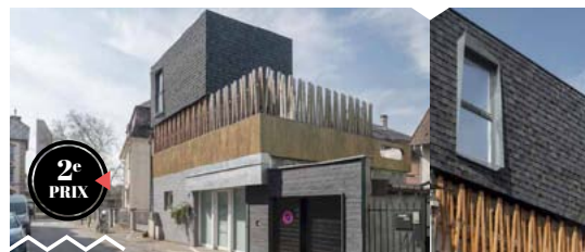
Palmarès Fibois Grand Est

Nouvelle édition du Palmarès Régional de la Construction Bois qui regroupe de nombreux projets récents de logements construits avec du bois dans la Région Grand-Est. A découvrir : des logements neufs ou transformés qui ont été sélectionnés par un jury de professionnels et par le grand public. Seront organisés en complément : 2 ateliers conseils-habitat ouverts au public et un circuit de visites de projets bois est en préparation. En partenariat avec FIBOIS Grand Est